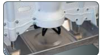
Loại 3: MaxiMat dành cho heo sữa đến heo thương phẩm 7-130kg