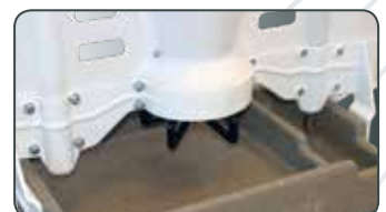
Loại 4: MaxiMat Poly cho dành heo sữa