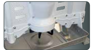
Loại 2: MaxiMat dành cho heo sữa 7-60 kg