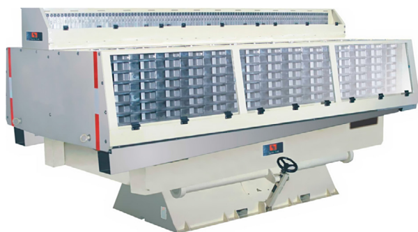
Table densimétrique à rebonds pour séparation finale du produit propre

La table SB sépare par gravité spécifique, le riz, blé, orge, avoine, etc., qui ont déjà été triés en épaisseur et en longueur. La Super Brix est également capable de séparer des produits qui ont le même poids spécifique mais qui ont une réaction différente aux effets du rebond.