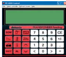
Datamix Transponder ESF