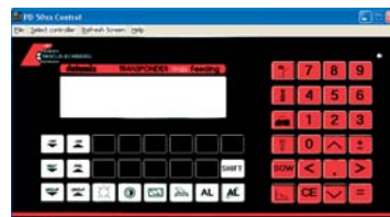
Datamix Transponder ESF (super)