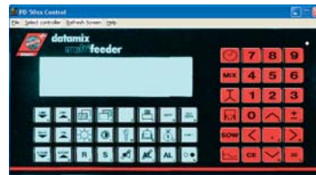
Datamix Multifeeder 5010