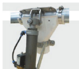
Té G.M. avec vérin