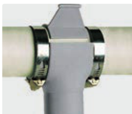
Té ø 60 P.M.