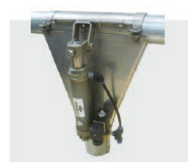
Té inox ø 60 avec vérin