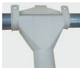
Té ø 60 G.M.